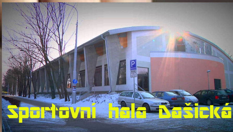
Sportovní hala Dašická