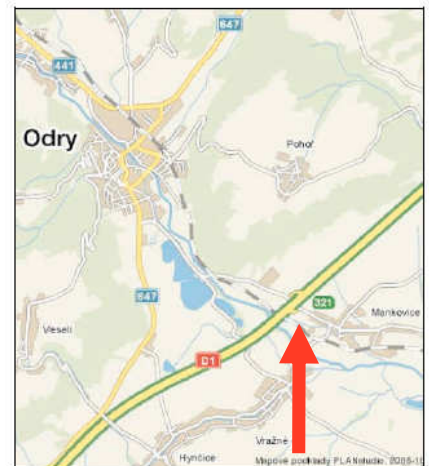
Nově otevřený sjezd z dálnice D1 na Odrý – EXIT 321 Mankovice